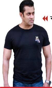
← বাবা সিদ্দিক খানের পর আভঙ্কে সালমান খান, বাড়ল নিরাপত্তা