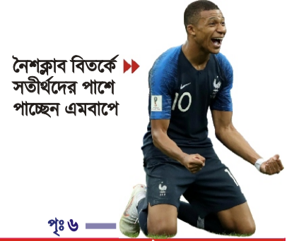
→ নৈশক্রাব বিতর্কে সতীর্থদের পাশে পাচ্ছেন এমবাপে