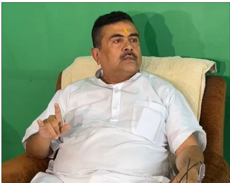
কলকাতা: নিউজ সারাদিন : সোমবার জেলাগুলিতে পুজোর কার্নিভাল হয়েছে। মঙ্গলবার কলকাতায় পুজো কার্নিভাল।

বিরোধী দলনেতা শুভেন্দু অধিকারী। কলেজ স্ট্রিট থেকে ধর্মতলা পর্যন্ত মিছিলের ডাক দেওয়া হয়েছে। বিকেল চারটে নাগাদ 'মমতার কার্নিভাল বয়কট করুন' নাম দিয়ে মিছিলের ডাক দিয়েছেন শুভেন্দু। শুভেন্দু অধিকারী জানিয়েছেন, দলীয় পতাকা ছাড়াই এই মিছিলে নামার জন্য আহ্বান করা হয়েছে। মিছিলে উপস্থিত থাকবেন দলের বিধায়ক ও সাংসদরা। তবে পুলিশের তরফে অনুরোধ করা হয়েছে, যেহেতু ধর্মতলায় কার্নিভালের কর্মসূচি রয়েছে। দ্রোহ কার্নিভাল রয়েছে। সেই কারণে মিছিল যেন সুবোধ মল্লিক ফ্লোয়ার পর্যন্ত গিয়েই শেষ হয়ে যায়। তবে এই কথা পুলিশ বললেও পরবর্তী পদক্ষেপ কী করা হবে তা এখনও জানা যায়নি। প্রসঙ্গত, কার্নিভালের পাশাপাশি ডাক্তারদের ডাকা দ্রোহ কার্নিভাল রয়েছে মঙ্গলবার। তিলোত্তমার ন্যায় বিচার ও নিজেদের সুরক্ষার দাবি নিয়ে আন্দোলনে নেমেছেন তারা। যদিও সরকারের তরফে ডাক্তারদের আহ্বান করা হয়েছে ওই দিন অনেক বিদেশের অনেক গেস্ট থাকবে। ফলে তাদের কাছে ভুল বার্তা যেতে পারে। সেই কারণে ওই দিন যাতে দ্রোহ কার্নিভাল বাতিল করেন তাঁরা। তবে চিকিৎসকরাও পরিষ্কার জানিয়েছেন তাঁরা কোনওভাবেই বাতিল করবেন না দ্রোহ কার্নিভাল।