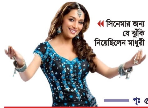
◀ সিনেমার জন্য যে ঝুঁকি নিয়েছিলেন মাধুরী