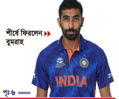
শীর্ষে ফিরলেন ▶ বুমরাহ