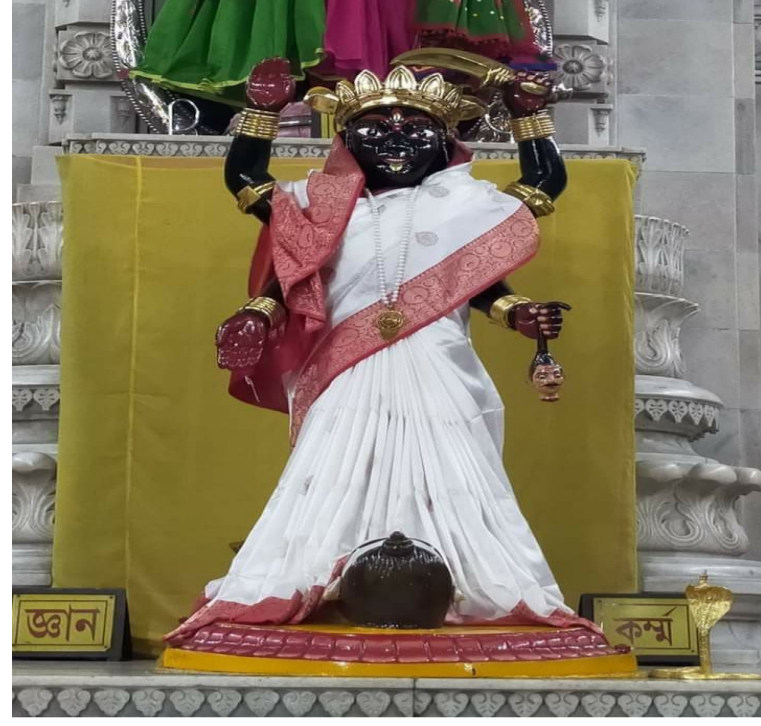
দর্শনার্থী প্রতিদিন উপাসনা, প্রার্থনা, গ্রহণের জন্য একত্রিত হন। দর্শনের অভিজ্ঞতা এবং প্রসাদ নিকটবর্তী নাটমন্দিরে (মিউজিক

মন্দিরটি এমনভাবে তৈরি করা হয়েছে যে যখনই দরজা খোলা হয় তখন বেদীটি সম্পূর্ণরূপে দৃশ্যমান হয়। হাজার হাজার তীর্থযাত্রী এবং