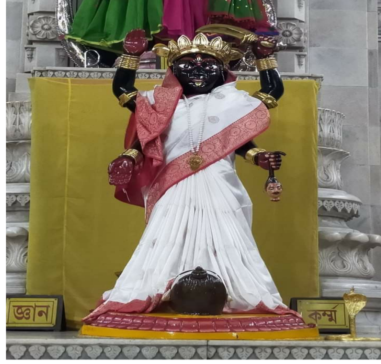
নীচের বেদীতে শ্রী রামকৃষ্ণের "গুরু" শব্দটি খোদাই করা আছে। একটি মূর্তি রয়েছে, যার কাছে মাঝখানের বেদীতে ইডেন গার্ডেনে

পদ্মাবতী এবং কাটরাজ। প্রধানমন্ত্রী ভিড়ে ওয়াড়ায় ক্রান্তীজ্যোতি সাবিত্রীবাঈ ফুলের প্রথম বালিকা বিদ্যালয়ের স্মারক সৌধ নির্মাণের শিলান্যাস করবেন। সুপার কম্পিউটিং প্রযুক্তিতে দেশকে আত্মনির্ভর করে তুলতে প্রধানমন্ত্রী যে অঙ্গীকার করেছেন, তা পূরণে তিনি ৩টি পরমরুদ্র সুপার কম্পিউটার জাতির উদ্দেশে উৎসর্গ করবেন। ন্যাশনাল সুপার কম্পিউটিং মিশনের আওতায় সম্পূর্ণ দেশীয় প্রযুক্তিতে নির্মিত এই কম্পিউটারগুলি তৈরিতে ব্যয় হয়েছে ১৩০ কোটি টাকা। উন্নত বৈজ্ঞানিক চিকিৎসার জন্য কলকাতা, পুণে এবং দিল্লিতে এই কম্পিউটারগুলি ব্যবহার করা হবে। জ্যোতির্বিজ্ঞানের বিভিন্ন পরীক্ষা-নিরীক্ষার জন্য পুণেতে জায়েন্ট মেট্রো রেডিও টেলিস্কোপ ব্যবহার করা হবে। দিল্লিতে মেটেরিয়াল সায়েন্স এবং পারমাণবিক পদার্থবিদ্যা গবেষণার কাজে ইন্টার ইউনিভার্সিটি অ্যাসেম্বলির সেন্টারে আরেকটি সুপার কম্পিউটার ব্যবহৃত হবে। পদার্থবিদ্যা, সৃষ্টিতত্ত্ব এবং ভূ-বিজ্ঞানের অত্যাধুনিক গবেষণার জন্য কলকাতার এস এন বোস সেন্টারে তৃতীয় সুপার কম্পিউটারটি কাজ করবে। প্রধানমন্ত্রী আবহাওয়া ও জলবায়ু গবেষণার জন্য একটি উচ্চ শক্তিসম্পন্ন কম্পিউটিং ব্যবস্থাপনারও উদ্বোধন করবেন। এর জন্য ব্যয় হয়েছে ৮৫০ কোটি টাকা। এরফলে, জলবায়ু সংক্রান্ত পূর্বাভাস সহ অন্যান্য কাজে ভারতের দক্ষতা বৃদ্ধি