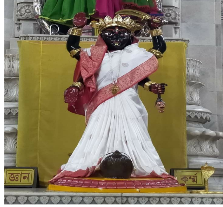
রামকৃষ্ণ পরমহংসদেবের জন্য এ ব্যবস্থা প্রতিদিনের। মূল সাড়ে বারো সের চালের রান্না হয়। মন্দিরের নির্মাণেও বৈচিত্র্যের

কিন্তু তা হয়নি। তাই নাট মন্দির থেকেই দর্শন করতে হয় দেবীকে। শীর্ষে রাধাকৃষ্ণ, তারপর আদ্যাশক্তি মহামায়া এবং দেবীর নীচে রামকৃষ্ণ পরমহংসদেব। এভাবেই সাজানো মূল মন্দিরের কক্ষ। ভোগেও বৈশিষ্ট্য রয়েছে। রাধাকৃষ্ণের জন্য সাড়ে বত্রিশ সের চালের রান্না হয়। দেবীর জন্য সাড়ে বাইশ সের চাল বরাদ্দ। এবং