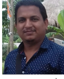
মৃত্যুঞ্জয় সরদার (অষ্টম পর্ব)

পার্বতীকে কুমারী মূর্তিতে পূজার প্রচলন সম্ভবত দক্ষিণ ভারতে কন্যাকুমারীতে। কিভাবে এবং কেমন করে এর শুরু? পুরাণ, ইতিহাস, প্রাকৃতিক সৌন্দর্য আর শিল্পের ডালিভরা কন্যাকুমারী। ভারতের পর্যটন মানচিত্রে দক্ষিণের শেষ প্রান্তভূমি। কাশী শিবের বাসগৃহ, শক্তির আবাসস্থল কন্যাকুমারী। তিন সাগরের মহামিলন ঘটেছে এখানে। পূর্বে বঙ্গোপসাগর, পশ্চিমে আরব সাগর, দক্ষিণে ভারত মহাসাগর-অতলাস্ত এই সাগর ত্রয়ীর তরঙ্গ সর্বদাই ধুয়ে