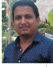
মৃত্যুঞ্জয় সরদার (তৃতীয় পর্ব)

ধরনের স্থাপত্যরীতি মন্দির। প্রাচীনতমটি পঞ্চরত্ন দেবী দুর্গার-- যা সংস্কারের ফলে মূল চেহারা হারিয়েছে। মন্দিরের প্রাচীন গঠনশৈলী বৌদ্ধ মন্দিরের মত। দশম শতকে এখানে বৌদ্ধ মন্দির ছিল--পরবর্তীতে কিভাবে সেন আমলে হিন্দু মন্দির হয়েছিল--তা ইতিহাসে লিখা নাই। ১১শ বা ১২শ শতক থেকে এখানে কালী পূজার সাথে দুর্গা পূজাও হত। ঢাকেশ্বরী মন্দিরের ইতিহাস সম্পর্কে নানা কাহিনী প্রচলিত আছে। ধারণা করা হয় যে, সেন রাজবংশের রাজা