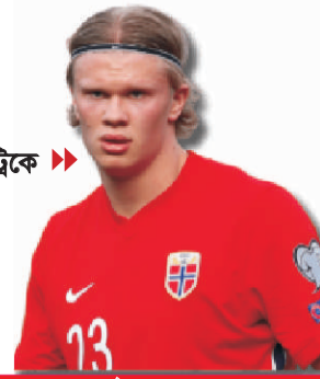
হল্যান্ডের হ্যাটট্রিকে বড় জয় সিটির