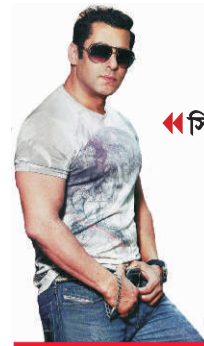
সিকান্দর হয়ে উঠতে ব্যাপক প্রস্তুতি