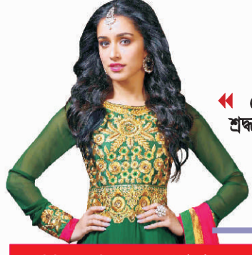
ভেঙে গেল শ্রদ্ধা কাপরের প্রেমা