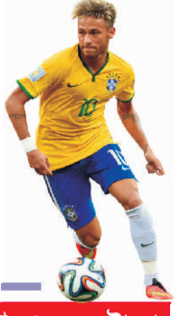
ই-স্পোর্টস বিশ্বকাপে খেলবেন নেইমার