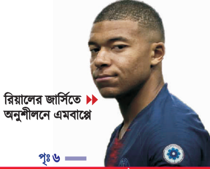
রিয়ালের জার্সিতে অনুশীলনে এমবাল্লে