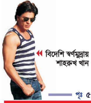
বিদেশি স্বর্ণমুদ্রায় শাহরুখ খান