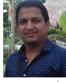
মৃত্যুঞ্জয় সরদার (চতুর্থ পর্ব)

৮০০, ৯০০, ১৮০০, ২১০০, ২৩০০, ২৫০০ ও ৩৩০০ মেগাহার্টজ এবং ২৬ গিগাহার্টজ ব্যান্ডগুলি নিলামে তোলা হয়। নিলাম শুরু হয় ২৫ জুন সকাল ১০টায়। ৭ রাউন্ডের পর ২৬ জুন সকাল ১১টা ৪৫ মিনিটে এই প্রক্রিয়া শেষ হয়। সম্প্রতি ৫জি স্পেকট্রামের নিলাম হওয়ায় এবং তার নগদীকরণের প্রক্রিয়া এখনও চলতে থাকায় ৮০০, ২৩০০, ৩৩০০ মেগাহার্টজ এবং ২৬ গিগাহার্টজ ব্যান্ডে কোনও বিডিং হয়নি। নিলামে তোলা ৫৩৩.৬ মেগাহার্টজ স্পেকট্রামের ২৬.৫ শতাংশ অর্থাৎ ১৪১.৪ মেগাহার্টজ নিলামে বিক্রি হয়েছে। এখানে উল্লেখ করা প্রয়োজন যে, কিছুদিন আগে ২০২২ সালের অগাস্ট মাসে ৫১.২ গিগাহার্টজ স্পেকট্রাম বিক্রি করার পরও এবারের নিলামে এমন সাড়া পাওয়া গেছে। টেলিকম পরিষেবা প্রদানকারী ৩টি সংস্থাই অর্থাৎ ভারতী এয়ারটেল, রিলায়েন্স জিও ইনফোকম এবং ভোডাফোন আইডিয়া এই নিলামে অংশ নেয়। মোট ১৪১.৪ মেগাহার্টজ স্পেকট্রাম বিক্রি করে ১১ হাজার ৩৪০ কোটি টাকা পাওয়া গেছে। ভারতী এয়ারটেল এবং ভোডাফোন আইডিয়া তাদের মেয়াদোত্তীর্ণ ৯০০ মেগাহার্টজ এবং ১৮০০ মেগাহার্টজ ব্যান্ড পুনর্নবীকরণ করেছে। এছাড়াও, টেলিকম পরিষেবা প্রদানকারী সংস্থাগুলি ৬১৬৪.৮৮ কোটি টাকার বিনিময়ে অতিরিক্ত ৮৭.২ মেগাহার্টজ স্পেকট্রাম কিনেছে। যে স্পেকট্রামগুলি এবারে বিক্রি হয়নি, সেগুলি আবার পরবর্তী সময়ে নিলামে তোলা হবে।