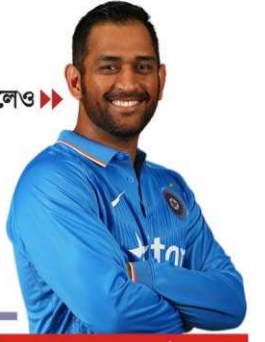
আগামী আইপিএলও খেলবেন ধোনি?