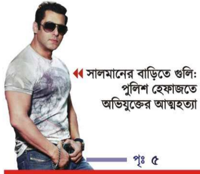
সালমানের বাড়িতে গুলি: পুলিশ হেফাজতে অভিযুক্তের আত্মহত্যা