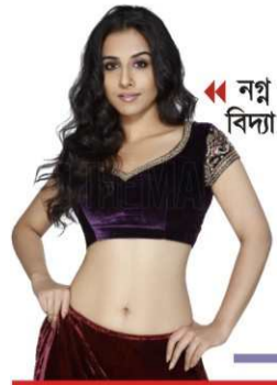
নগ্ন পুরুষদের নিয়ে বিদ্যা বালানের মন্তব্য