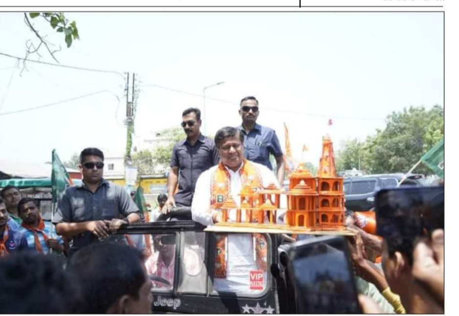
হুটখোলা গাড়িতে গঙ্গারামপুর এবং বুনিয়াদপুরে প্রচার করলেন সুকান্ত।