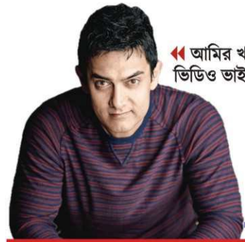
আমির খানের ভিডিও ভাইরাল!