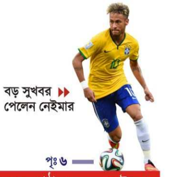
বড় সুখবর পেলেন নেইমার