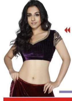
ইভাস্ট্রি কারও বাবার নয়, বিফোরক মন্তব্য বিদ্যার