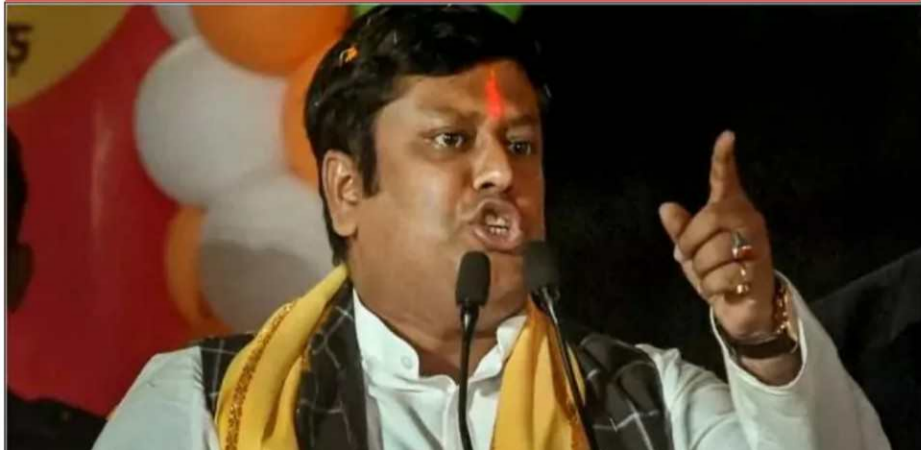
আজ দক্ষিণ দিনাজপুর জেলার হরিরামপুরে

তৃণমূলের প্রার্থী তথা রাজ্যের ত্রেতা সুরক্ষা মন্ত্রী বিপ্রব মিত্রের সমর্থনে জেলায়