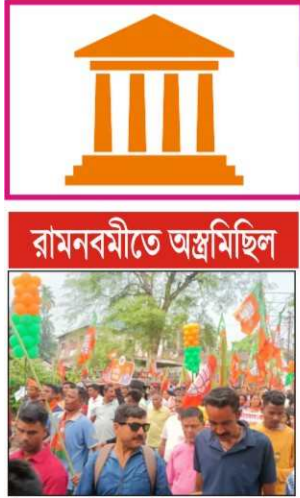
স্টাফ রিপোর্টার, নিউজ সারাদিন : রামনবমীতে অস্ত্র মিছিল।