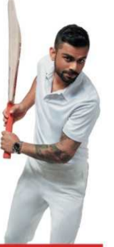
মাঠেই কান ধরে ফ্রমা চাইলেন কোহলি