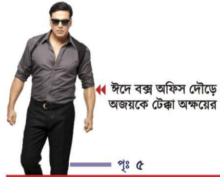
ইদে বক্স অফিস দৌড়ে অজয়কে টেকা অক্ষয়ের