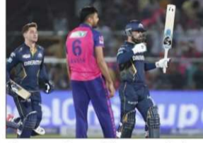
স্টাফ রিপোর্টার, নিউজ

স্টাফ রিপোর্টার, নিউজ সারাদিন : সাল্লু স্যামসন ও রিয়ান পরাগের দারুণ দুটি ইনিংসে ভর করে বেশ বড় সংগ্রহ পেয়েছিল রাজস্থান রয়্যালস। দুর্দান্ত ফর্মে থাকা দলটি তাতে টানা পঞ্চম জয়ের আশাই করছিল হয়তো। কিন্তু উড়তে থাকা দলটিকে আসরে প্রথম হারের স্বাদ দিল গুজরাট টাইটান্স। ২০২৪ আইপিএলের ২৪তম ম্যাচে আজ ৩ উইকেটে জয় পেয়েছে গুজরাট। ঘরের মাঠ জয়পুরে আগে ব্যাট করে ৩ উইকেটে ১৯৬ রানের সংগ্রহ দাঁড় ছিল বিরী রাজস্থান। যা নিয়ে শেষ বল পর্যন্ত লড়াই করে তারা। কিন্তু শেষ পর্যন্ত ৭ উইকেট হারানো গুজরাট-ই জয়ের মুখ দেখে। তবে জয়ের জন্য ভাগ্যকেও ধন্যবাদ দিতে পারে তারা। কারণ মছর ওভার রেটের কারণে বেশ ওভারে মাত্র ৪ ফিল্ডার ৩০ গজের বাইরে রাখতে পারে তারা। সেই সুযোগ কাজে লাগিয়ে ব্যাকওয়ার্ড পয়েন্ট দিয়ে চার মেরে ম্যাচ শেষ করে দেন রশিদ খান। তাছাড়া মাত্র দুই ওভার বোলিং করেছেন দারুণ ছন্দে থাকা রাজস্থানের কিউই ফাস্ট বোলার ট্রেন্ট বোল্ট। ওই দুই ওভারে মাত্র ৮ রান খরচ করেন তিনি। টানা ৪ ম্যাচ জেতার পর হারল রাজস্থান। তবে হারলেও পয়েন্ট তালিকার শীর্ষেই আছে তারা। ৫ ম্যাচে তাদের সংগ্রহ ৮ পয়েন্ট। দুইয়ে থাকা কলকাতা নাইট রাইডার্সের সংগ্রহ ৪ ম্যাচে ৬ পয়েন্ট। সমান পয়েন্ট গুজরাটেরও। তবে রানরেটের ব্যবধানে পিছিয়ে থাকায় ছয়ে আছে তারা। দলটি ম্যাচও খেলে ফেলেছে ৬টি। রাজস্থানের ছুড়ে দেওয়া বড় লক্ষ্য তাড়ায় শুরুটা দারুণ হয় গুজরাটের। দুই ওপেনার সাই সুদর্শন ও শুভমান গিল মিলে তুলে ফেলেন ৬৪ রান। তবে এরপর হন্দপতন ঘটে। সুদর্শন ফিরে যান ২৯ বলে ৩৫ রান করে। তিন ও চারে নামা