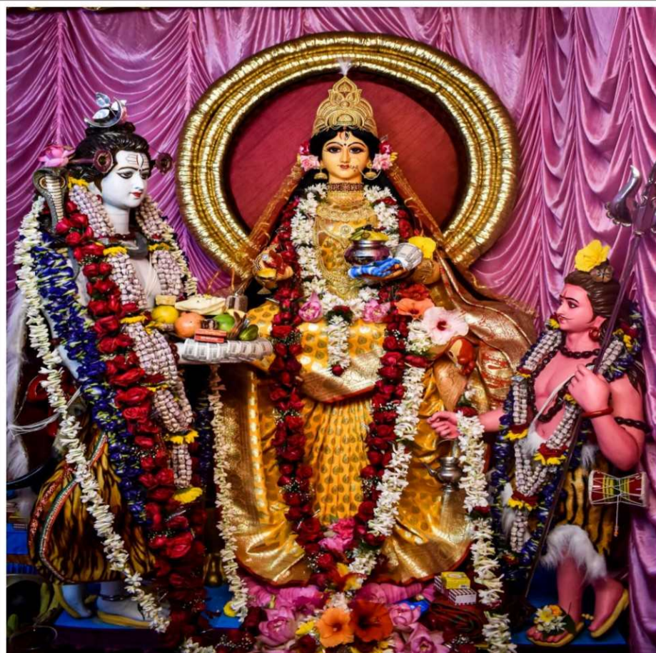
শ্রী শ্রী রাজেশ্বরীঅন্নপূর্ণা মা সিদ্ধেশ্বরীকালী মন্দির, ৭কে, এম সা স্ট্রীট শ্রীরামপুর থানার পাশে, হুগলি