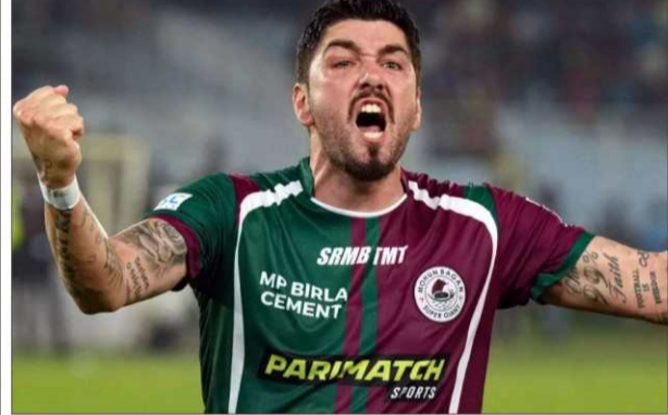
স্টাফ রিপোর্টার, নিউজ

স্টাফ রিপোর্টার, নিউজ সারাদিন : মোহনবাগানের কাছে ঘরের মাঠে এই ম্যাচের গুরুত্ব কতটা ছিল, এ আর নতুন করে বলার প্রয়োজন পড়ে না। প্রত্যেকটা প্লেয়ারই মন থেকে চাইছিলেন। পরিশ্রমের ফলও মিলল। আইএসএলে এ বার মাঝ পথে খেই হারিয়েছিল মোহনবাগান। ইংরেজি বছরের শুরুতেই কোচ বদলও হয়। দায়িত্ব দেওয়া হয় আন্তোনিও লোপেজ হাবাসকে। তাঁর হাতে দল পড়তেই আবারও সেই আত্মসমী মোহনবাগানকে খুঁজে পাওয়া যায়। যার পুরস্কার এই লিগ শিল্ড জয়। ইন্ডিয়ান সুপার লিগে প্রথম বার লিগ শিল্ড জয় মোহনবাগান। তেমনই ইন্ডিয়ান সুপার লিগের ইতিহাসে প্রথম বার মুম্বই সিটি এফসিকে হারাতেই হত। মোহনবাগানের কাছে ঘরের মাঠে এই ম্যাচের গুরুত্ব কতটা ছিল, এ আর নতুন করে বলার প্রয়োজন পড়ে না। প্রত্যেকটা