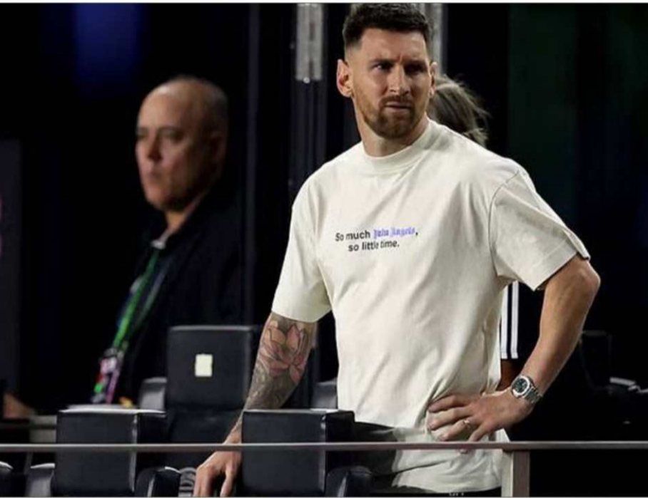
স্টাফ রিপোর্টার, নিউজ