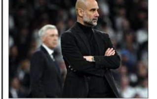
স্টাফ রিপোর্টার, নিউজ

স্টাফ রিপোর্টার, নিউজ সারাদিন : রোমাঞ্চকর ম্যাচ ড্র করার পরেও আনন্দে ভেসেছে ম্যানচেস্টার সিটি। রিয়াল মাদ্রিদের মাঠে ৩ গোল দেওয়া তো কম কথা নয়। তবে নতুন সান্তিয়াগো বার্নাবু নিয়ে অভিযোগ রয়েছে সিটি কোচ পেপ গার্দীওলার। মাঠের ঘাসকে আরও উন্নত করার কথা জানান তিনি। গতকাল রাতে চ্যাম্পিয়নস লিগের কোয়ার্টার ফাইনালের প্রথম লেগে রিয়ালের সঙ্গে ৩-৩ গোলে ড্র করে সিটি। রোমাঞ্চকর এই ম্যাচে শুরুতে সিটি এগিয়ে গেলেও রিয়াল কামব্যাক করে প্রথমার্ধেই। তবে বিরতির পর সিটি আবারও এগিয়ে যায়। শেষদিকের গোলে অবশ্য ড্র নিয়ে সন্তুষ্ট থাকতে হয় স্বাগতিকদের। এই ড্রয়ে অবশ্য স্বস্তি পাচ্ছে সিটি। যদিও ঘাস নিয়ে অভিযোগ রয়েছে তাদের। রিয়াল মাদ্রিদের এই ঐতিহ্যবাহী স্টেডিয়ামটি সংস্কারের পর আরও দৃষ্টিনন্দন করে গড়া হয়েছে। অবশ্য সংস্কার কাজ এখনও পুরোপুরি শেষ হয়নি। ম্যানচেস্টার সিটি কোচ বললেন, স্টেডিয়াম দেখতে দারুণ হলেও এই মাঠে খেলার অভিজ্ঞতা ভালো হয়নি তার দলের। খেলোয়াড়রা অভিযোগ করেছে মাঠের ঘাস নিয়ে। গার্দীওলা বলেন, 'স্টেডিয়ামটি দুর্দান্ত। তাদের এখন ঘাসের মানের দিকে খেয়াল রাখতে হবে। এটা উন্নত করতে হবে আরও। ফ্লোরেন্তিনোর (রিয়ালের সভাপতি ফ্লোরেন্তিনো পেরেস) এখন কেবল মাঠ ভালো করা নিয়েই ভাবতে হবে, মাদ্রিদের মাঠ সবসময় যেমন (ভালো) ছিল।' 'আমার দলের ছেলেরা আমাকে এরকমই বলেছে। লোকের অবশ্য এটাকে খারাপভাবে দেখা উচিত নয়। স্টেডিয়াম তো চোখধাঁধানো। আমি যখন খেলেছি, মাদ্রিদের মাঠও সবসময় দুর্দান্ত ছিল। কার্পেটের মতো ছিল এটি। এখন আগের মতো নেই। তবে আমি নিশ্চিত, তারা এটা ঠিক করে ফেলবে।' ফিরতি লেগে ইতিহাদ স্টেডিয়ামে আগামী বৃহস্পতিবার রিয়ালকে আতিথ্য দেবে ম্যানচেস্টার সিটি।