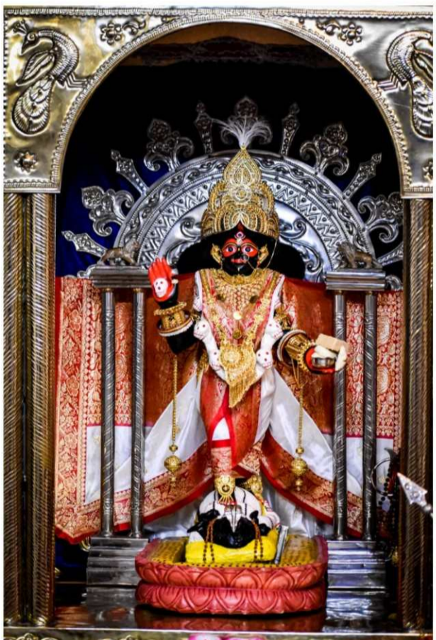
।। মা সিদ্ধেশ্বরী ।। শুভ জন্মদিন শ্রী শ্রী সিদ্ধেশ্বরীকালী মন্দির ৭ কে, এম সা স্ট্রীট, শ্রীরামপুর থানার পাশে, হুগলি

ভক্তবৃন্দের উপস্থিতি ও সহযোগিতা কামনা করি