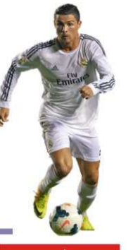
রোনালদোর ৬৪তম হ্যাটট্রিকে আল নাসেরের দাপটে জয়