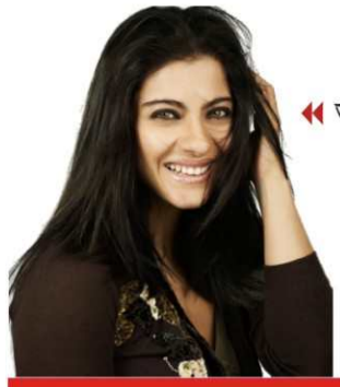
ভক্তদের সুখবর দিলেন কাজল