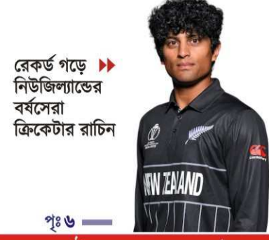
রেকর্ড গড়ে নিউজিল্যান্ডের বর্ষসেরা ক্রিকেটার রাচিন