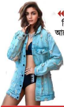
নারী অধিকার নিয়ে বলিউডের আলোচিত সিনেমা