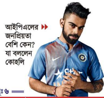
আইপিএলের জনপ্রিয়তা বেশি কেন? যা বললেন কোহলি

Digital media act No. : DM /34/2021 • Govt. of India Reg No. : WB18D0018520 (UAN) • ISBN No. : 978-93-5918-830-0 • Website : https://paper.newssaradin.live/ • বর্ষ : ৩ সংখ্যা : ০৭১ • কলকাতা • ২৯ ফাল্গুন, ১৪৩০ • বুধবার • ১৩ মার্চ, ২০২৪ পৃষ্ঠা - ৬ ৫ টাকা