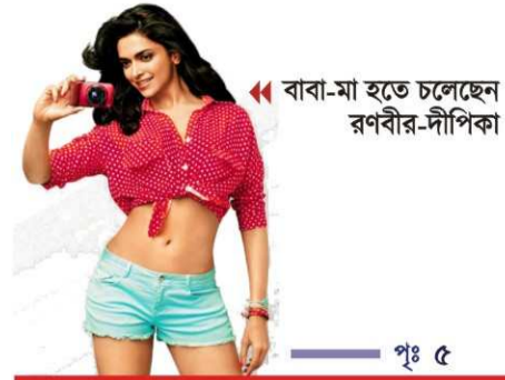
বাবা-মা হতে চলেছেন রণবীর-দীপিকা