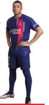
রিয়ালকে নতুন কী শর্ত দিলেন এমবাপ্পে?