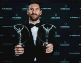
স্টাফ রিপোর্টার : নিউজ সারাদিন

লিওনেল মেসির বাড়িতে পুরস্কার রাখার জায়গা নেই। তার অষ্টম ব্যালন ডি'অর ও বার্সেলোনার জাদুঘরে দিয়ে দিয়েছেন। গোয়েন্দা বুটসহ অন্যান্য পুরস্কারও আছে বার্সার জাদুঘরে। এরই মধ্যে আরও এক পুরস্কারের জন্য মনোনীত হয়েছেন তিনি। তার সঙ্গে তালিকায় আছেন আরও দু'জন। তারা হলেন- ম্যানচেস্টার সিটির তরুণ স্ট্রাইকার আলিৎ হ্যালান্ড এবং রিয়াল মাদ্রিদের ইংলিশ মিডফিল্ডার জুড বেলিংহাম। মেসি যে পুরস্কারের জন্য মনোনীত হয়েছেন তা হলো- লরিয়াস ওয়ার্ল্ড স্পোর্টস অ্যাওয়ার্ড। এর মধ্যে মেসি ও হ্যালান্ড লরিয়াস ওয়ার্ল্ড স্পোর্টসম্যান অব দ্য ইয়ারের জন্য মনোনীত হয়েছেন। তারের সঙ্গে ওই তালিকায় আছেন নোভাক জোকোভিচ, মুভো ডু পলানটিস, ম্যাক্স ভাস্টাউপেনার। ২০ বছর বয়সী জুড বেলিংহাম লরিয়াস ওয়ার্ল্ড ব্রেক থ্রু অব দ্য ইয়ারের তালিকায় আছেন। লিডা কেইসেদো, কোকো গাউফ, সালমা প্যারালাউলোর। মেসি এবার লরিয়াস জিতলে এক বছরে পুরস্কারের হাটটুক হবে তার। গত ১২ মাসের মধ্যে তিনি ব্যানন ডি'অর ও ফিফা দ্য বেস্ট জিতছেন।