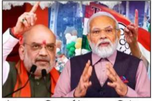
স্টাফ রিপোর্টার, নিউজ

শাসকদলকে ছাপিয়ে আসন দখল করবে বিজেপি! জনমত সমীক্ষায় বিরাট রদবদল