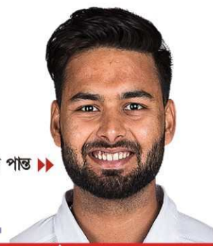
আইপিএলে ফিরছেন পাস্ট