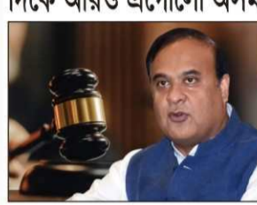
স্টাফ রিপোর্টার, নিউজ

বাতিল পৃথক মুসলিম বিবাহ আইন, অভিনু দেওয়ানি বিধির দিকে আরও এগোলো অসম