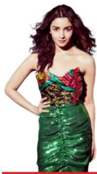
নজর কাড়লেন আলিয়া