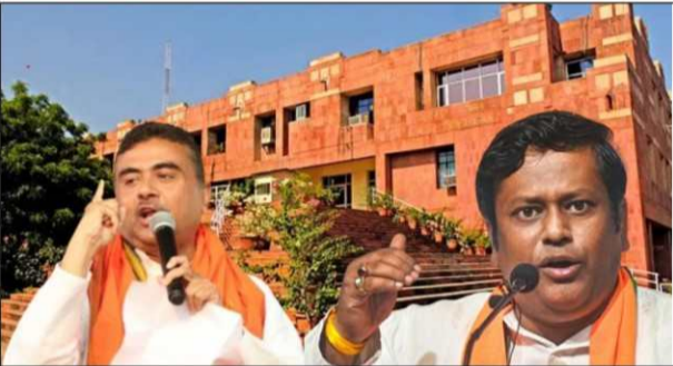
স্টাফ রিপোর্টার, নিউজ