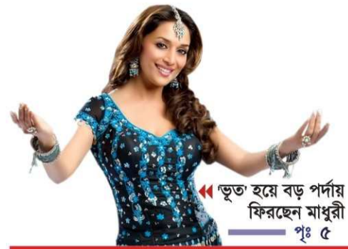
ভূত হয়ে বড় পর্দায় ফিরছেন মাধুরী পূঃ ৫