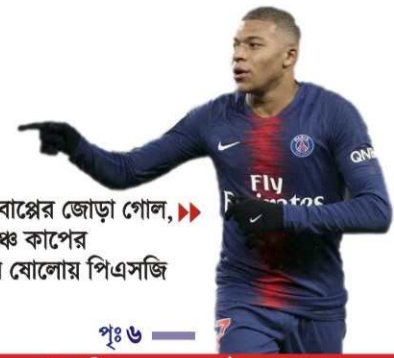
এমবাল্পের জোড়া পোল, ফ্রেঞ্চ কাপের শেষ বোলোয় পিএসজি