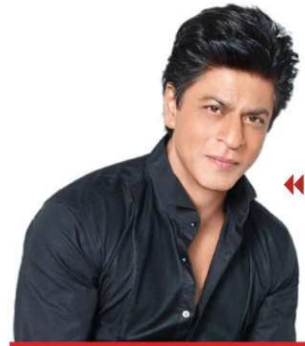
সিনেমা বিশ্লেষকদের মুখ বালেন শাহরুখ!