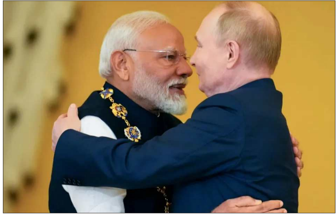
ভারতের প্রধানমন্ত্রী নরেন্দ্র মোদিকে

সর্বোচ্চ নাগরিক সম্মাননা দিয়েছে রাশিয়া। সোমবার দুই দিনের সফরে