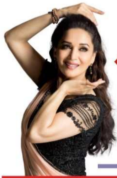
মাধুরীর রাজনীতিতে যোগদানের গুঞ্জন