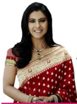
শ্রীলঙ্কানির্দেশে অভিনয়ের অভিজ্ঞতা জানালেন কাজল