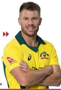
বিদায়ী টেস্ট সিরিজ খেলতে নেমেই ওয়ার্নারের সেঞ্চুরি