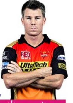
জনসনের জবাবে অবশেষে মুখ খুললেন ওয়ানার