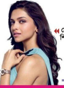
ফের কটাক্ষের শিকার দীপিকা