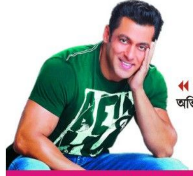
বাংলা সিনেমার অভিনয় করতে চান সালমান খান