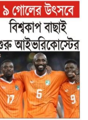
স্টাফ রিপোর্টার : নিউজ সারাদিন

স্টাফ রিপোর্টার, নিউজ সারাদিন : পাকিস্তানের জাতীয় পুরুষ ক্রিকেট দলের প্রধান নির্বাচক হিসেবে নিয়োগ দেওয়া হয়েছে সাবেক পেসার ওয়াহাব রিয়াজকে। শুক্রবার পাকিস্তান ক্রিকেট বোর্ড (পিসিবি) তাকে নিয়োগ দেয়। প্রধান নির্বাচক হিসেবে তার প্রথম অ্যাসাইনমেন্ট হতে যাচ্ছে অস্ট্রেলিয়ার বিপক্ষে তিন ম্যাচ টেস্ট সিরিজ। যেটা অস্ট্রেলিয়ায় ১৪ ডিসেম্বর শুরু হয়ে চলবে ৭ জানুয়ারি পর্যন্ত। এরপর পাকিস্তান ১২ জানুয়ারি থেকে ২১ জানুয়ারি পর্যন্ত নিউজিল্যান্ডের বিপক্ষে পাঁচ ম্যাচ টি-টোয়েন্টি সিরিজ খেলবে। প্রধান নির্বাচক হয়ে রিয়াজ বলেন, জাতীয় পুরুষ দলের নির্বাচক কমিটির প্রধান হতে পেরে আমি সম্মানিত এবং এই দায়িত্ব আমাকে অর্পণ করার জন্য পিসিবি ম্যানেজমেন্ট কমিটির চেয়ারম্যান জাকা আশরাফের প্রতি কৃতজ্ঞতা জানাই। ক্রিকেট সংক্রান্ত বিষয়ে প্রাক্তন খেলোয়াড়দের সম্পৃক্ত করার সিদ্ধান্ত ধর্ষণসনীয় এবং আমি পাকিস্তান ক্রিকেটের উন্নতির জন্য কাজ করতে ইচ্ছুক। ২০০৮ সালে পাকিস্তান দলে অভিষেক হয়েছিল রিয়াজের। সেই থেকে অবসরে যাওয়ার আগ পর্যন্ত তিনি ২৭টি টেস্ট, ৯১টি ওয়ানডে ও ৩৬টি টি-টোয়েন্টি খেলেন। তিন ফরম্যাটে উইকেট নেন ২৩৭টি। আর রান করেন ১২০০। বিশ্বকাপের মধ্যে তিনি পাকিস্তানের দ্বিতীয় সেরা ও সফল বোলার। তিন বিশ্বকাপে তিনি বল হাতে দ্বিতীয় সর্বোচ্চ ৩৫ উইকেট নেন।