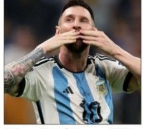
স্টাফ রিপোর্টার : নিউজ

সারাদিন : কাতার বিশ্বকাপ শেষেই অবসরে যাওয়ার কথা ছিল লিওনেল মেন্সির। তবে বিশ্ব চ্যাম্পিয়ন হওয়ার পর সে সিদ্ধান্ত বদলেছে আর্জেন্টাইন মহাতারকার। আরও কিছুদিন দলের সঙ্গে সময়টা উপভোগ করতে চান তিনি। কিন্তু ঠিক কতদিন খেলতে চান, সেটা স্পষ্ট করেননি।