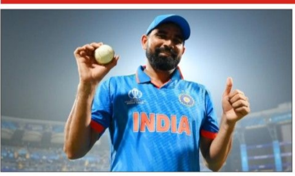
স্টাফ রিপোর্টার : নিউজ

সারাদিন : উজান গাঙে বৈঠা ঠেলে তীর পাওয়া মাঝি মোহাম্মদ শামি, যাঁকে নিয়ে গল্প করা যায়। ব্যক্তি জীবনে দুর্দশা, ম্যাচ পাতানোর অভিযোগ, সেখান থেকে হতাশা, সঙ্গে ইনজুরির বাধা-ঝামেলা, কি ছিল না তাঁর ক্যারিয়ার! যে কূল ধইরা চললে নদী সে কূল ভাইসা যায়। কবিতার লাইনের মতো ভেঙে পড়েছিলেন শামিও। বেছে নিতে চেয়েছিলেন আত্মহত্যার পথ। কিন্তু দুই শব্দের আই কুইট' বাক্য না লিখে 'বি চ্যাম্পিয়ন' পথে হেঁটেছেন ৩৬ বছর বয়সী এই ডানহাতি পেসার। ঘরের মাঠে অনুষ্ঠিত বিশ্বকাপে শুরুর আগেই পেসার শামি। হার্দিক পাণ্ডিয়ার ইনজুরিতে একাদশে টুকে দু'বার ফাইফারসহ তিন ম্যাচে তিনি নিয়েছেন ১৪ উইকেট। বিশ্বকাপে ভারতের হয়ে সর্বোচ্চ ৪৫ উইকেট নিয়েছেন। ওয়ানডেতে ভারতীয়দের মধ্যে সর্বাধিক চারবার ফাইফার তাঁর। টানা দুই বিশ্বকাপে তিনবার করে ইনিংসে চার উইকেট নেওয়ার কীর্তি গড়েছেন। সব মিলিয়ে শামি যেন ভারতীয় দলের জন্য