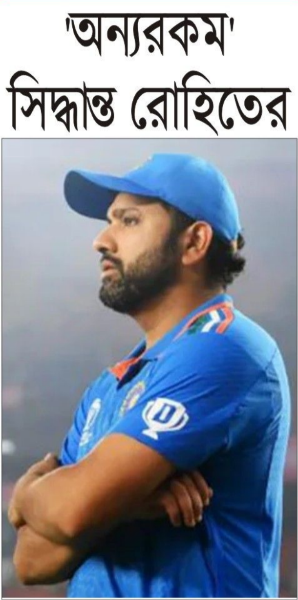
স্টাফ রিপোর্টার, নিউজ

সারাদিন : এবারের বিশ্বকাপে সব ম্যাচে জেতার রেকর্ড ধরে রেখেছে ভারত। বৃহস্পতিবার তারা হারিয়েছে শ্রীলঙ্কাকে। সেই ম্যাচে নজর কেড়ে নিয়েছে ভারতের দু'টি রিভিউয়ের সিদ্ধান্ত। দুটিতেই ঠিক প্রমাণিত হয়েছে তারা। ম্যাচের পরে রোহিত শর্মা জানিয়েছেন, এখন আর তিনি ডিআরএস নেবেন না। সেই দায়িত্ব পেয়ে গিয়েছেন দলেরই দুই ক্রিকেটার। তিনি উইকেটকিপার কেএল রাহুল এবং সংশ্লিষ্ট বোলার। শ্রীলঙ্কা ম্যাচে একটি এলবিউইয়ের ক্ষেত্রে রাহুলের সিদ্ধান্ত মেনে নিয়ে ডিআরএস নেন রোহিত। আমাদের এই পরিকল্পনা কাজে লাগছে।"