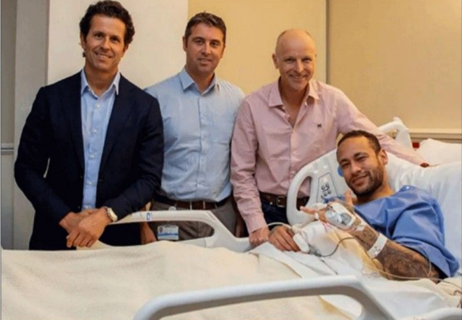
স্টাফ রিপোর্টার : নিউজ