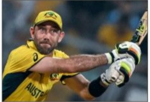
স্টাফ রিপোর্টার : নিউজ

সারাদিন : অস্ট্রেলিয়া ড্রেসিংরুমে লেখা, আই ক্যান ডু ইট, আই উইল ডু ইট। লেখার এই আই হয়ে উঠলেন গ্লেন ম্যাক্সওয়েল। বিশ্বকাপের মঞ্চে অস্ট্রেলিয়া সর্বাধিক ২৮৬ রান ত্যাগ করে জিতেছিল অস্ট্রেলিয়া। আফগানদের হারাতে হলে রেকর্ড গড়তে হত। বোর্ডে ২৯২ রানের লক্ষ্য। নবীন উল হক এ বৎ আজ মত উল্লাহ ওমরজাইয়ের অনবদ্য বোলিং। সঙ্গে যোগ দেন স্পিনাররা। মাত্র ৯১ রানে ৭ উইকেট হারায় অস্ট্রেলিয়া। সেখান থেকে জয়! ছয় মেরে ডাবল সেঞ্চুরি এবং ম্যাচ ফিফিনশ করেন গ্লেন ম্যাক্সওয়েল। তাঁর অবিশ্বাস্য ইনিংসে সেমিফাইনালও নিশ্চিত অস্ট্রেলিয়ার। ম্যাচের আগের দিন সচিন তেডুলকারের পরামর্শ। মাস্টার ব্লাস্টারের উপস্থিতি বাড়তি প্রেরণা জুগিয়েছে আফগান শিবিরকে। মাঠের পারফরম্যান্সে সেটাই দেখা গেল। ওয়াংখেড়ে সেটায়ামে আফগান ক্রিকেটের নতুন অধ্যায়। সামনে পাঁচ বারের বিশ্ব চ্যাম্পিয়ন। এর আগে তিন সাক্ষাৎকারে তিন বারই হার। গত দুটি ওডিআই বিশ্বকাপের মঞ্চে অস্ট্রেলিয়ার কাছে বড় ব্যবধানে হেরেছে আফগানরা। এ বারের বিশ্বকাপে অবশ্য নতুন আফগান টিমকে দেখা গিয়েছে। ডিফেন্ডিং চ্যাম্পিয়ন ইংল্যান্ডকে হারিয়ে চমক দিয়েছিল তারা। অঘটন হিসেবেই দেখা হয়েছিল সেই ম্যাচ। তবে অঘটন বারবার ঘটে না।