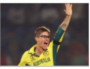
স্টাফ রিপোর্টার : নিউজ

৩৬ বছরের আক্ষেপ ঘুচিয়ে গত বছর তৃতীয় বিশ্বকাপ শিরোপা জেতা আর্জেন্টিনার নজর এখন ২০২৬ বিশ্বকাপে। আপাতত তাদের সব পরিকল্পনা বাড়াইপর্বের ম্যাচকে ঘিরে। কাতার বিশ্বকাপের পর এখানেও সামনে থেকে নেতৃত্ব দিয়ে যাচ্ছেন মেন্সি। ইনজুরির কারণে এক ম্যাচ খেলতে না পারলেও বাকি তিন ম্যাচেই ছিলেন আর্জেন্টাইন মহাতারকা। ইকুয়েডর ও পেরুর বিপক্ষে দলকে জিতিয়েছেন একাই। ওই দুই ম্যাচেই মেন্সির পা থেকে এসেছে ৩ গোল। বয়সটা বেড়ে ৩৬ হলেও মাঠের পারফরম্যান্সে এখনো যেন চিরতরুণ তিনি। মেন্সির কাছে তাই প্রশংসা, পরবর্তী বিশ্বকাপেও খেলতে চান কিনা তিনি? এ বিষয়ে মেন্সি বলেন, '২০২৬ বিশ্বকাপ? বয়স বিবেচনায় ওই সময় পর্যন্ত খেলা আমার জন্য কঠিন। কিন্তু দেখা যাক...'