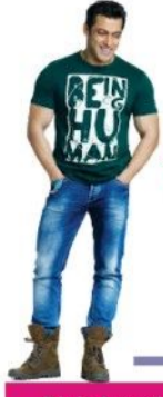
ফিরছেন টাইগার, এক ঝলকেই বাজিমাত সালমানের