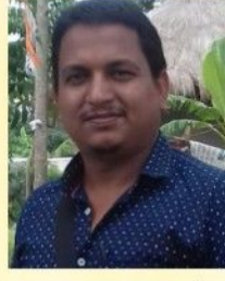
মৃত্যুঞ্জয় সরদার (একাদশ পর্ব)

মন থেকে চন্দ্রমা। নাভির উৎপত্তি হলো, তা থেকে অপান বায়ু, অপান থেকে মৃত্যু। এরপর উৎপত্তি হলো জননেন্দ্রিয়ের, তা থেকে বীর্য, বীর্য থেকে আবার সেই জল (ত্রৈতরীয়-১/১/৪)। অতঃপর ঐ পুরুষের মধ্যে তিনি যুক্ত করে দিলেন ক্ষুধা-তৃষ্ণার অনুভূতি।