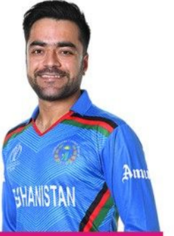
সিদ্ধান্ত পরিবর্তন: বিগ ব্যাশ খেলবেন রশিদ খান