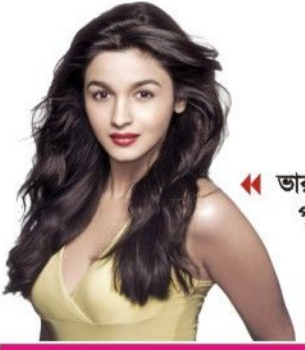
ভারতের জাতীয় চলচ্চিত্র পুরস্কার জিতলেন যারা