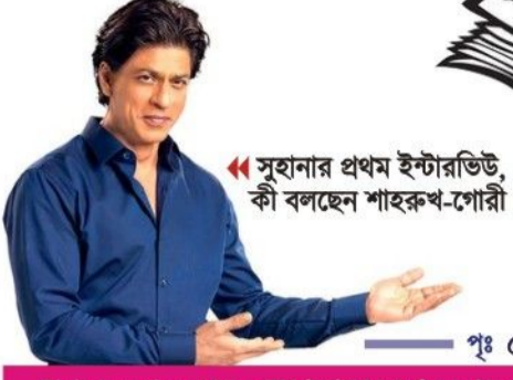
সুহানার প্রথম ইন্টারভিউ, কী বলছেন শাহরুখ-গোঁরা