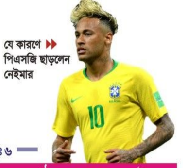
যে কারণে পিএসজি ছাড়লেন নেইমার