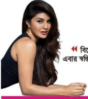
বিশেষজ্ঞা নিয়ে এবার স্বস্তিতে জ্যাকুলিন