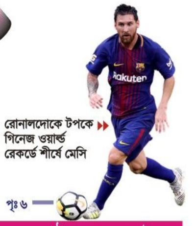
রোনালদোকে টপকে গিনেজ ওয়ার্ল্ড রেকর্ডে শীর্ষে মেসি