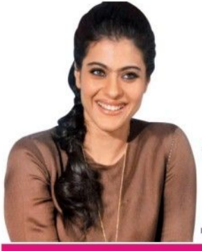
শাহরুখের অজানা কাহিনি ফাঁস করলেন কাজল