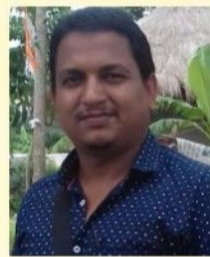
মৃত্যুঞ্জয় সরদার (প্রথম পর্ব)

মা দুর্গা দেবীর পূজা নিয়ে আজ যারা ব্যঙ্গ করছে, তারা হয়তো ভুলে গেছে এই পৃথিবীতে পাপ আর পড়াচিন্তে বিচার তিনি করে যাচ্ছে। তিনি মনুষ্য কুলের সমাধান সৃষ্টিকারী মহাশক্তি। স্বয়ং মা দুর্গা মানুষকে বরাবর বিপদ থেকে রক্ষা করেছেন। তেমনই এক উদাহরণ আজকের সমাজে প্রায় ৪৫০- ৪৫৩ বছর আগেকার কথা আমি তুলে ধরতে চাই! লাহা বাড়ির ইতিহাস আজ আমাদের অজানা নয়। অনেকে হয়তো জানেই না, লাহা বাড়ির দুর্গাপূজা কিসের কারণে শুরু হয়েছিল। স্বয়ং মা দুর্গা লাহা বাড়ির জমি বিবাদের পাশে এসে দাঁড়িয়েছিল। গ্রামের জমি বিবাদ আজও আছে, তৎকালীন সময়ে লাহা বাড়ির জমির বিবাদ কে নিয়ে কোট পর্যন্ত মামলা গড়িয়েছিল। সেই মামলা করেছিলেন স্বয়ং মা দুর্গা। তবেই স্বয়ং মা দুর্গা হয়তো, বর্তমান মহামারী করোনোভাইরাস কে বিনাশ করে দেবে। এমন ভক্তি বিশ্বাস হয়তো আজ আপনাদের নেই, কারণ আমরা নিজেদের প্রতি বিশ্বাস ও ভরসা হারিয়ে ফেলি। বর্তমান দেশ বা রাজ্যের যা পরিস্থিতি একমাত্র সমাধানের পথ দেখাতে পারেন স্বয়ং মা নিজেই। যেমনি লাহা বাড়ির পথ