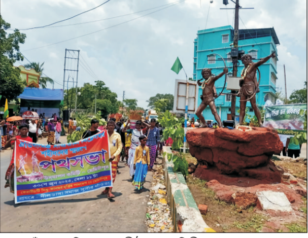
সাঁওতাল বিদ্রোহের পীঠস্থান মেদিনীপুর শহর সংলগ্ন কেরানীচটিতে সিধু কানুর মূর্তিতে মাল্যদান এবং শ্রদ্ধা নিবেদনে স্থানীয় মানুষজনের উপস্থিতি চোখে পড়ার মতো। রিপোর্ট এবং ছবি অরবিন্দ অধিকারী