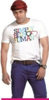
শাহরুখের জওয়ান নিয়ে উচ্ছ্বসিত সালমান খা বললেন