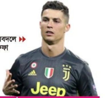
আল নাসরকে দলবদলে নিষেধাজ্ঞা দিল ফিফা